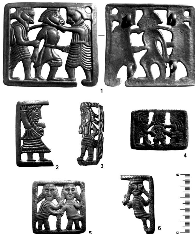
Рис. 3. 1 – бронзовая накладка (недокументированная находка из Иркутской области); 2 – фрагмент бронзовой накладки из разрушенного погребения у городища Нивагальское 20 (по: Карачаров, 2011: ил. 5); 3 – фрагмент бронзовой накладки (недокументированная находка из Зауралья); 4 – бронзовая накладка (недокументированная находка из Зауралья); 5 – бронзовая накладка (недокументированная находка с Нижней Оби); 6 - фрагмент бронзовой накладки из Ишимской коллекции (КККМ № 56-54)